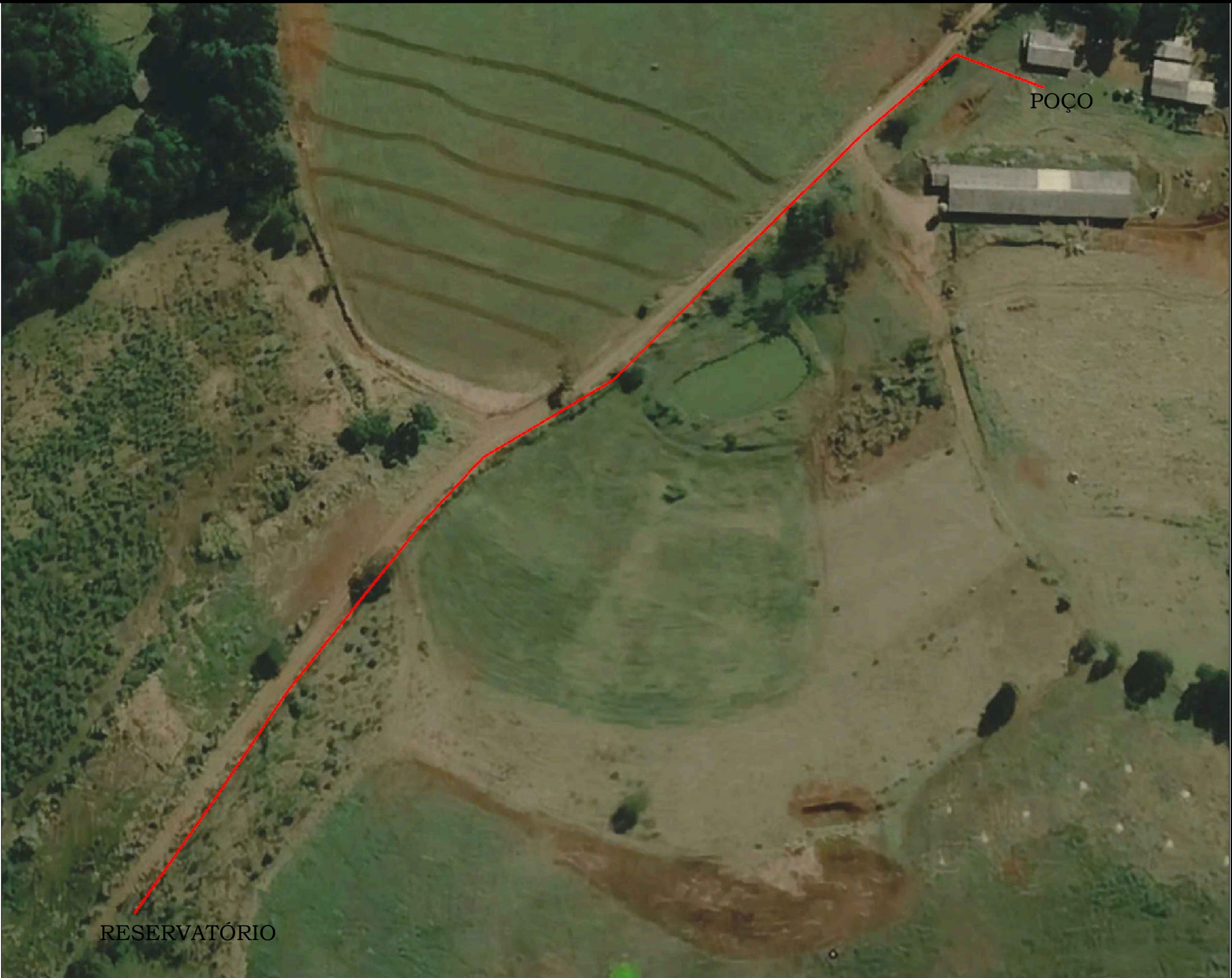
LOCALIZAÇÃO E TRAÇADO LINHA APARECIDA (-26.118177°, -53.287016°) ESCALA 1:1000