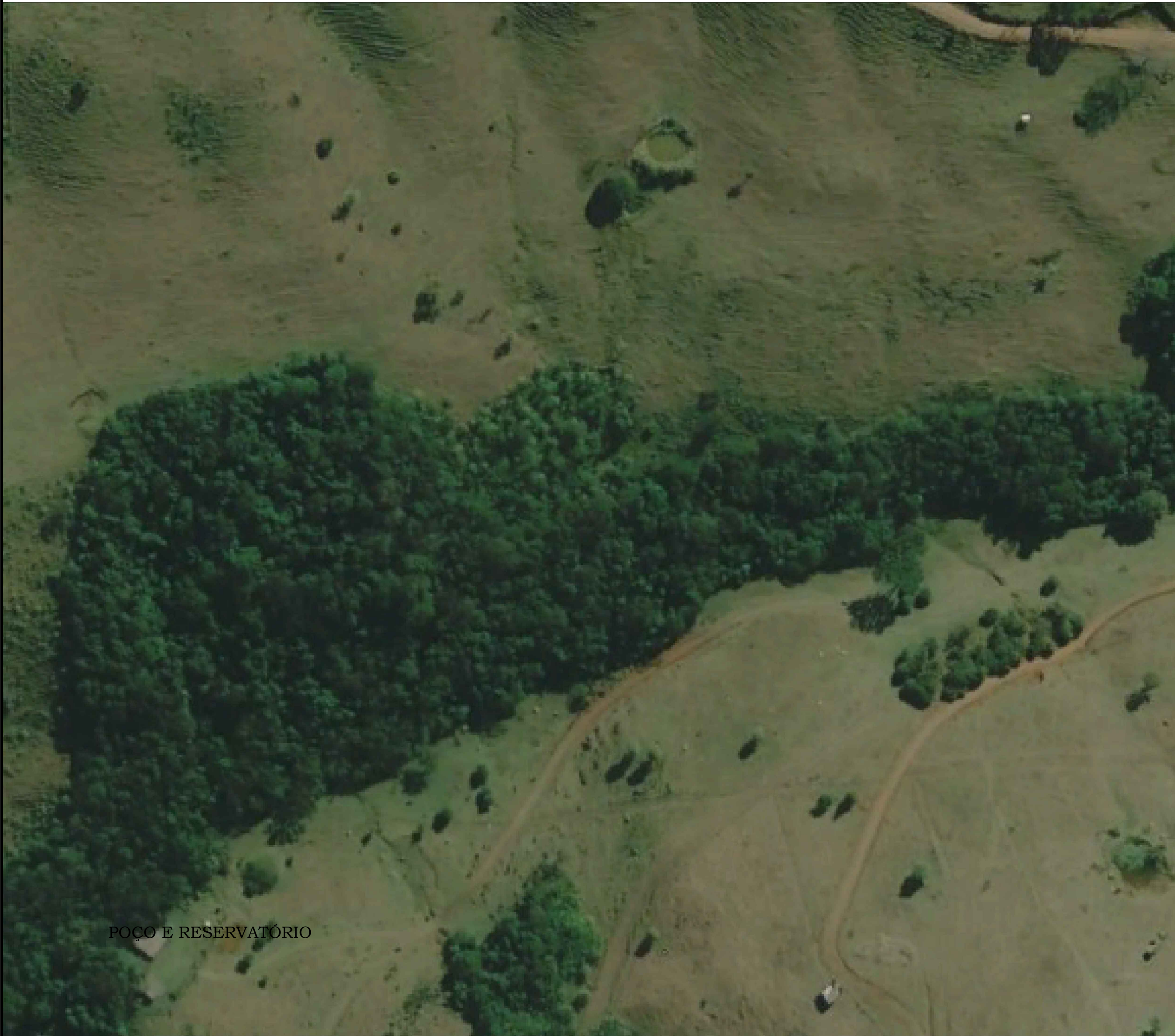
LOCALIZAÇÃO - LINHA FREIRE (-26.058728°, -53.324046°) ESCALA 1:1000